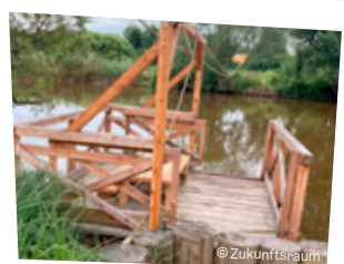
Floß in Thaya