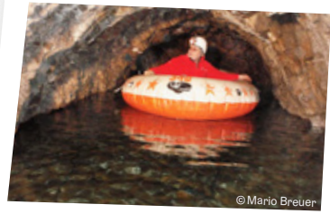
Bootsfahren im Haidl-Keller