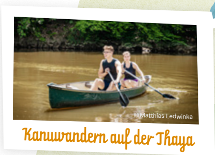
Kanuwandern auf der Thaya