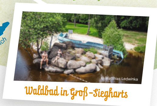
Waldbad in Groß-Siegharts