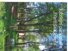
Jubiläum park Draßau Františka Josefa